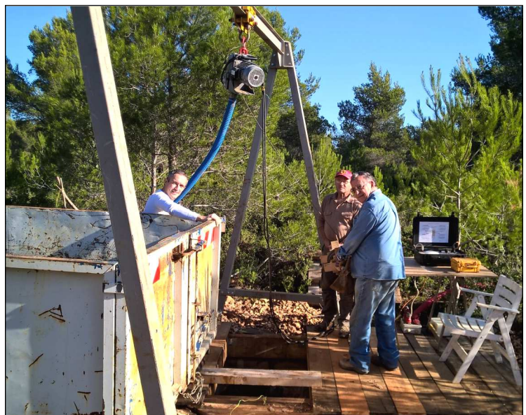
Le puits de 32 m au début, a été équipé de tuyaux pour aspirer le gaz carbonique abondant (Oxygène 17,5%)