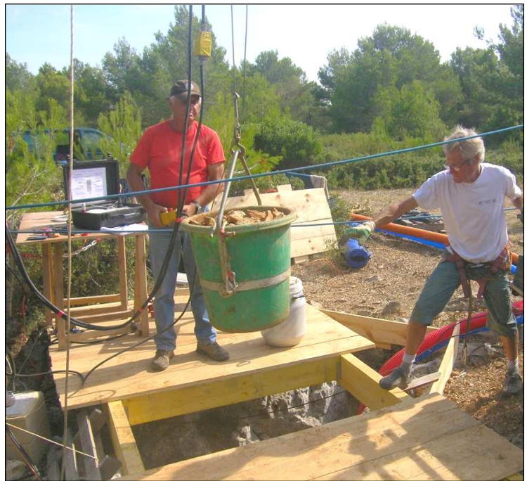
Les moyens ont été mis en œuvre : un portique avec un superbe treuil alimenté par un générateur. Le bidon de 70 litres pèse 150 kg quand il est plein.