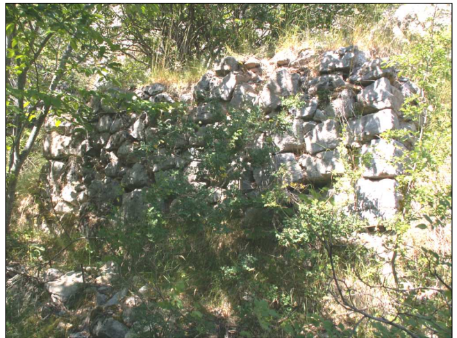
Fig. 5 : La partie la plus visible des vestiges de la chapelle : le mur en soutènement, coté est.

Il ne reste vraiment pas grand-chose de cette petite chapelle formant un carré d'environ 4 m de côté. Vers la grotte, le mur subsiste sur une quarantaine de centimètres de hauteur, sur les côtés il est à ras du sol et vers le chemin d'accès, subsiste le mur en soutènement, sur une hauteur de 1,5m (fig. 3 et 5). Il ne tardera pas à disparaître complètement avec les dures conditions climatiques d'altitude.