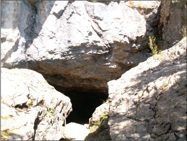
Fig. 4 : Au pied d'une barre rocheuse, l'entrée de la grotte en partie masquée par deux gros blocs rocheux.

Il est amusant de reprendre en partie la description que faisait l'abbé Féraud au XIX e siècle : Au fond git un stalactite (sic) ayant la figure d'un énorme serpent de cinq mètres de long et de 50 cm de largeur. On dirait un dragon préposé à la garde de l'ancre, dormant d'un paisible sommeil et déroulant ses anneaux au fond d'une eau stagnante. La merveille la plus curieuse de cette grotte est ce qu'on appelle la cheminée. Elle se trouve entre le puits et la cave, sur la surface du fond. Les parois du rocher sont chargées d'une masse de stalactites de formes et de couleurs différentes... Ce spectacle, en un mot, est si plein de charme, qu'on ne peut se lasser de contempler ce jeu de la nature. Cette description dithyrambique prête aujourd'hui à sourire. Elle a été faite avant l'avènement de la spéléologie et les termes ne sont pas toujours exacts. Il n'y a ni stalactite, ni stalagmite tombée au sol et le serpent est en fait constitué par les volutes calcaires qui bordent les gours (bassins naturels) et que connaissent bien tous les spéléologues (fig. 3). Mais, cette description nous permet de constater qu'au XIX e siècle les gours retenaient encore de l'eau, différemment d'aujourd'hui. Ces gours devaient constituer une réserve d'eau pour les éventuels ermites.